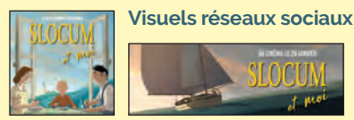
Visuels réseaux sociaux