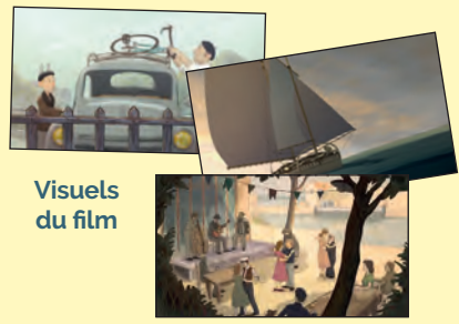
Visuels du film