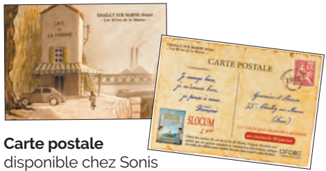
Carte postale disponible chez Sonis