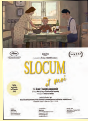
Dossier de presse