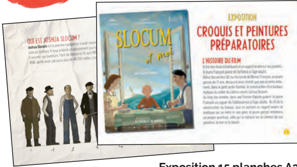
Exposition 15 planches A3 à commander chez Sonis