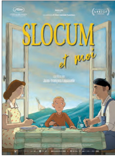
Affiche 120 x 160 cm Affiche 40 x 60 cm en vente chez Sonis