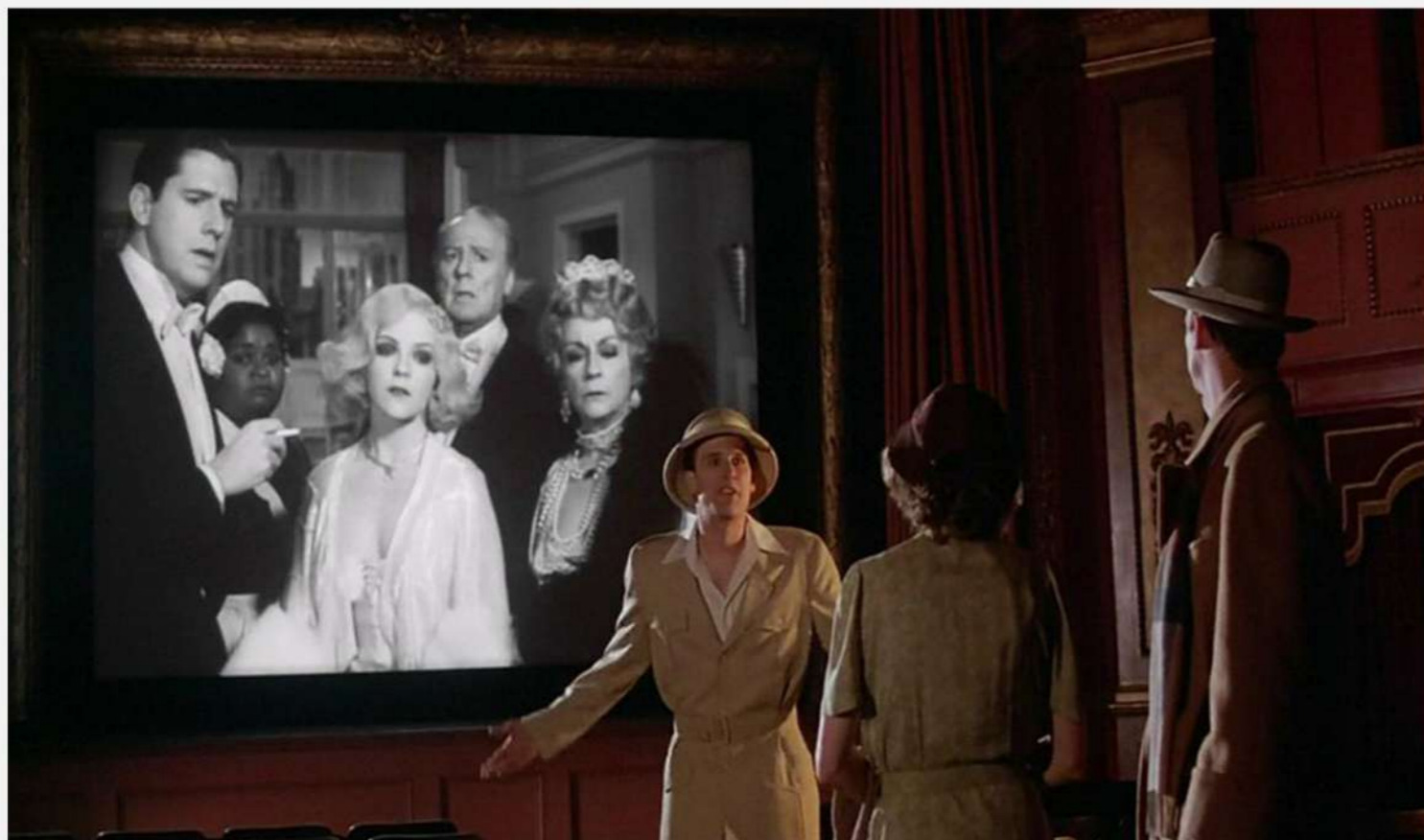
La Rose pourpre du Caire

Dans le film de Woody Allen, son personnage sort de l'écran pour aller dans le monde réel tandis que le personnage de Sherlock Junior rentre dans l'écran.