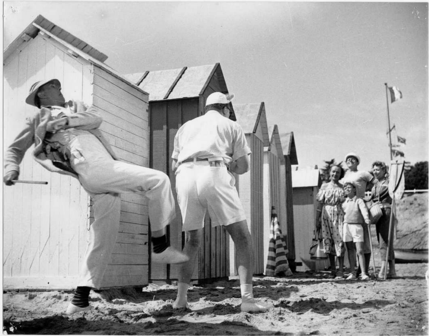
Les vacances de M. Hulot