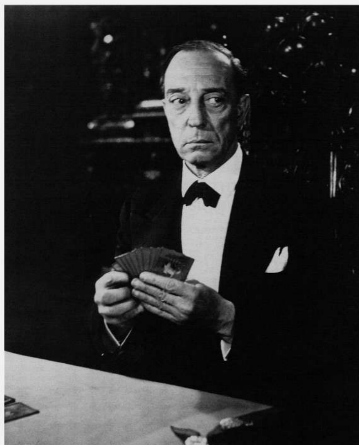
Boulevard du crépuscule