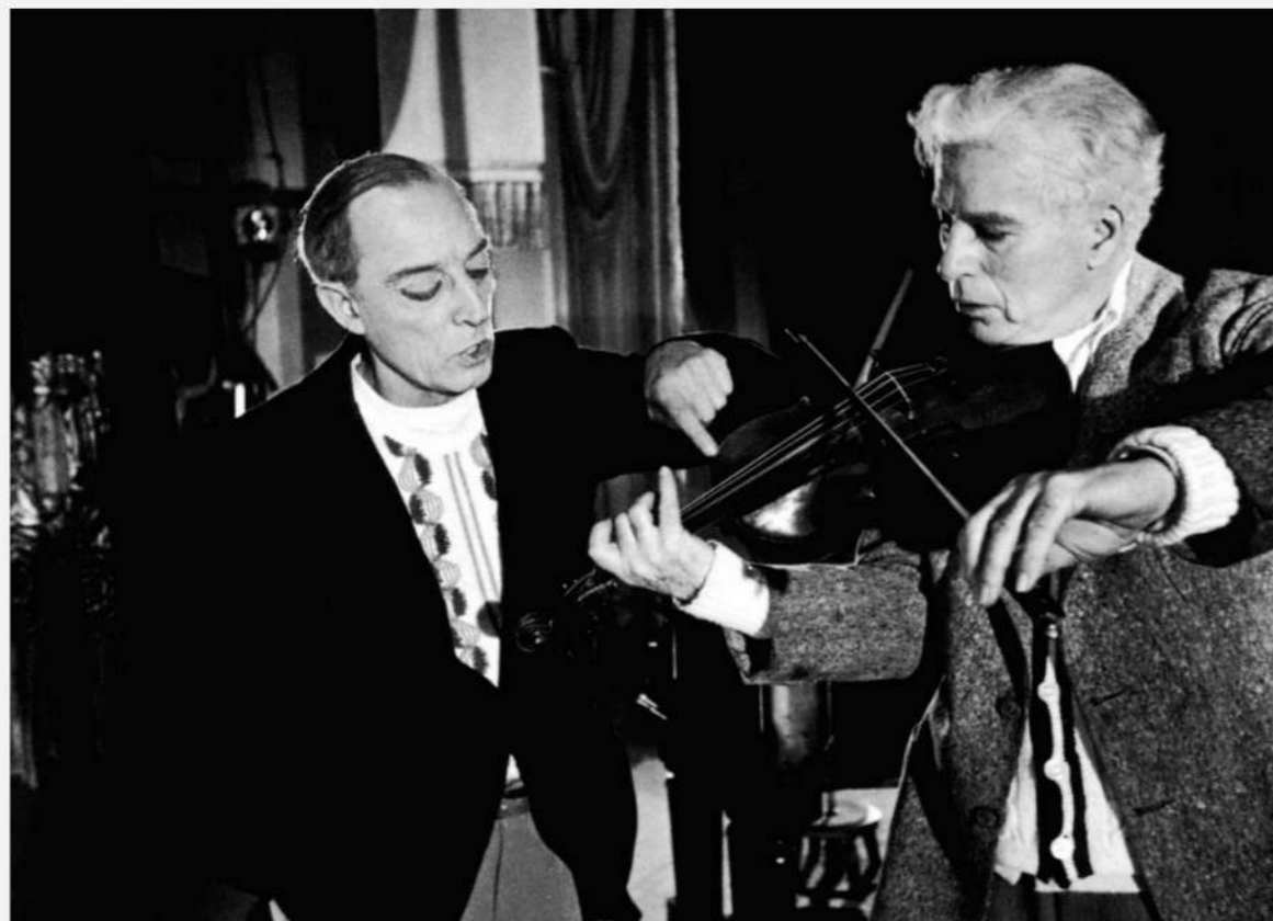
Les feux de la rampe