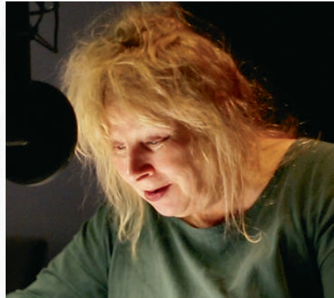
Mémé Oignon interprétée par Yolande Moreau