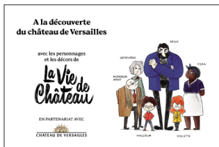
Carnet du spectateur disponible chez Sonis