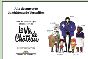
Carnet du spectateur

Ce film bénéficie du soutien du groupe Jeune Public AFC@E CINÉMAS ART & ESSAI