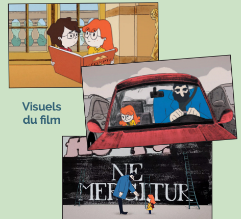
Visuels du film