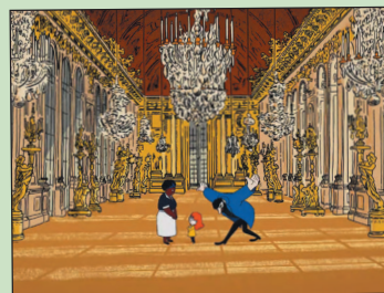
Dossier de presse