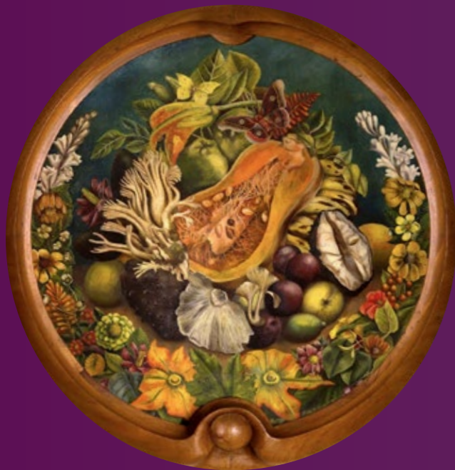
BODEGÓN (NATURE MORTE) huile sur toile, 1942.