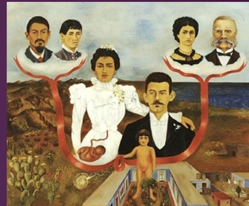
MIS ABUELOS, MIS PADRES Y YO (MES GRANDS-PARENTS, MES PARENTS ET MOI) huile sur toile, 1936.