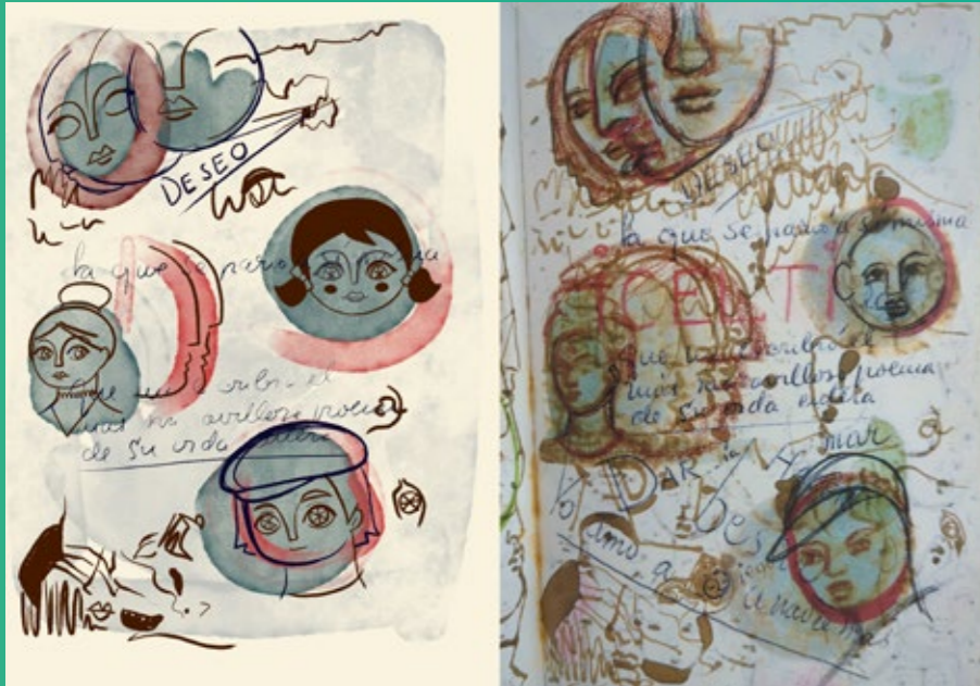
Carnet de dessins, Technique mixte