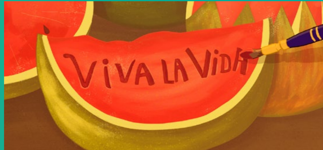
VIVA LA VIDA (VIVE LA VIE) huile sur toile, 1954.