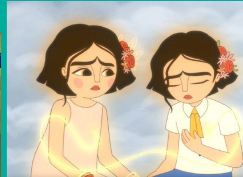
LOS DOS FRIDAS (LES DEUX FRIDA) huile sur toile, 1939.