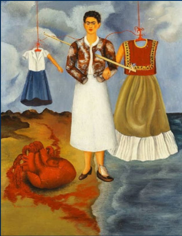
RECUERDO (MÉMOIRE, LE CŒUR) huile sur toile, 1937.