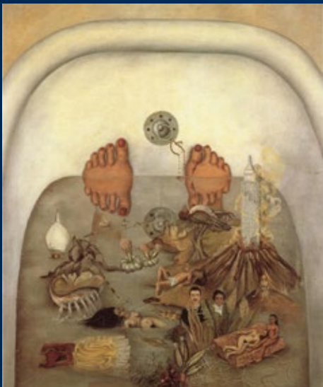
LO QUE EL AGUA ME DIO (CE QUE L'EAU M'A DONNÉ) huile sur toile, 1938.