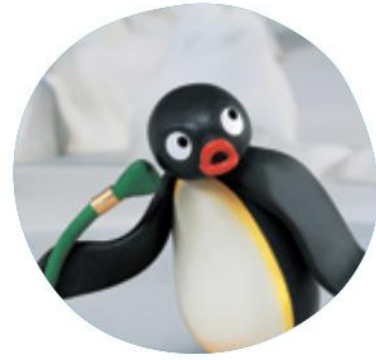
La Voix mystérieuse