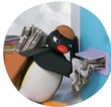
Le Livreur de journaux