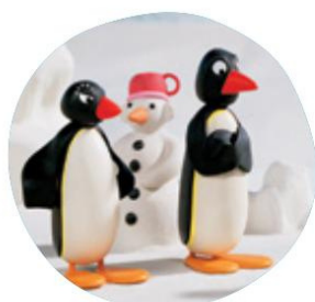
Papa et maman