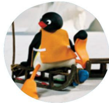
L'École de luge