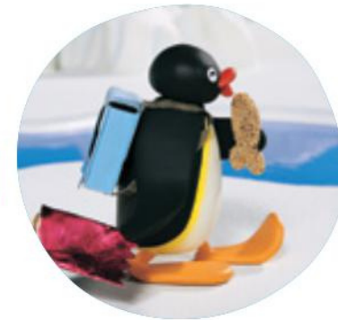
Les Papiers d'emballage

Ce programme de Pingu en huit épisodes permet de revenir sur un personnage qui a marqué une génération d'enfants des années 90. Sa gestuelle et son fameux "Noot Noot" restent célèbres. À travers toutes ces aventures dans un univers en pâte à modeler, nous retrouvons des situations liées à la petite enfance et à la vie quotidienne.