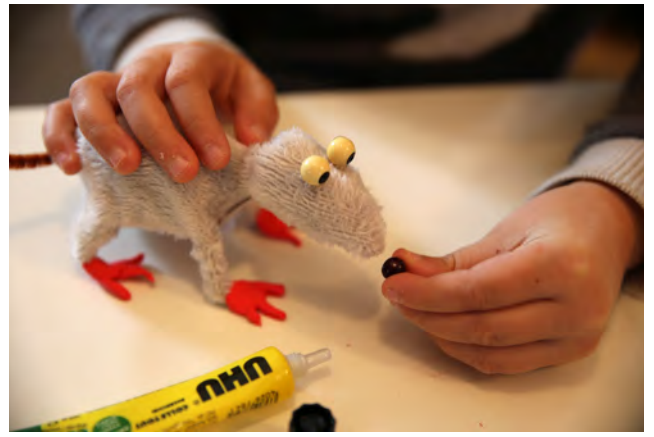
Coller les perles blanches des yeux et une noire ou rose pour le nez.