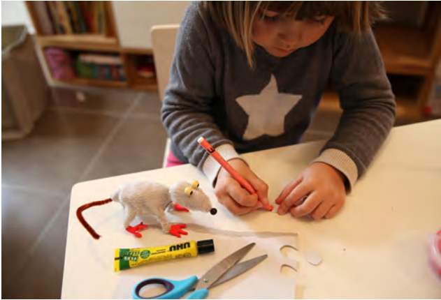
Découper les deux oreilles dans un papier cartonné et colorer une des faces en rose.