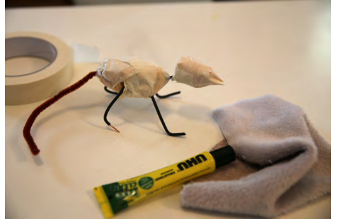
Entourer la mousse de ruban adhésif à peindre, sans trop serrer, pour obtenir la forme souhaitée