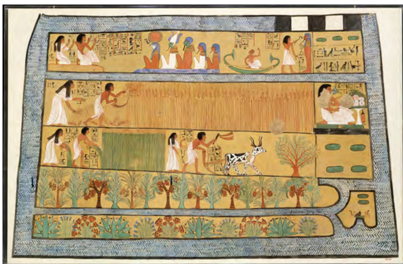
« Paradis » égyptien : Les Champs des Roseaux, Tombe de Senedjem, Vallée des nobles, Haute Égypte

Il y a plusieurs siècles, voire millénaires, les Incas en Amérique du sud ou les Égyptiens de l'antiquité, au temps des pharaons, croyaient aussi à cette autre vie possible après la mort. Une croyance est probablement née de ce que les hommes pouvaient simplement observer chaque jour. Le soleil tombait dans l'horizon à l'ouest chaque soir et renaissait le lendemain matin à l'est. Une vie nouvelle jaillissait des grains plantés dans la terre une fois la plante fanée, la lune croissait et décroissait... L'observation de ces cycles peut laisser penser que nous puissions, nous aussi, renaître d'une autre manière.