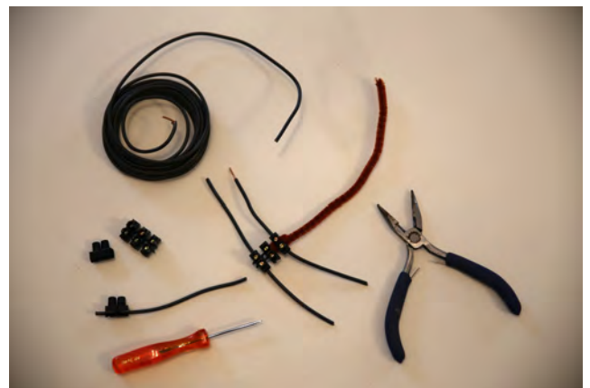
assemblage de l'armature, 1 fil pour les 2 pattes avant, 1 pour les 2 pattes arrière, 1 pour le cou et la tête, le cure pipe pour la queue.