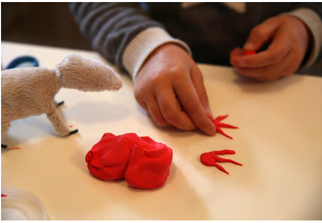
Enfiler les pattes en pâte à modeler sur l'extrémité des armatures laissées apparentes.