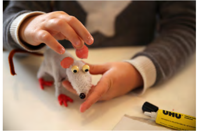
Coller les oreilles sur la tête