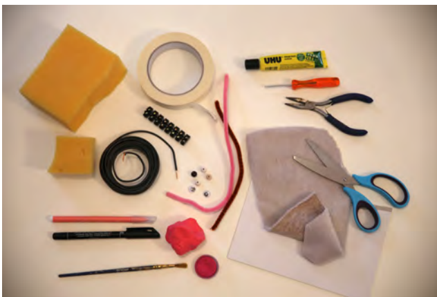
Le matériel nécessaire

Petit tournevis, colle, ciseaux, pince coupante, feutres permanents rose et noir.