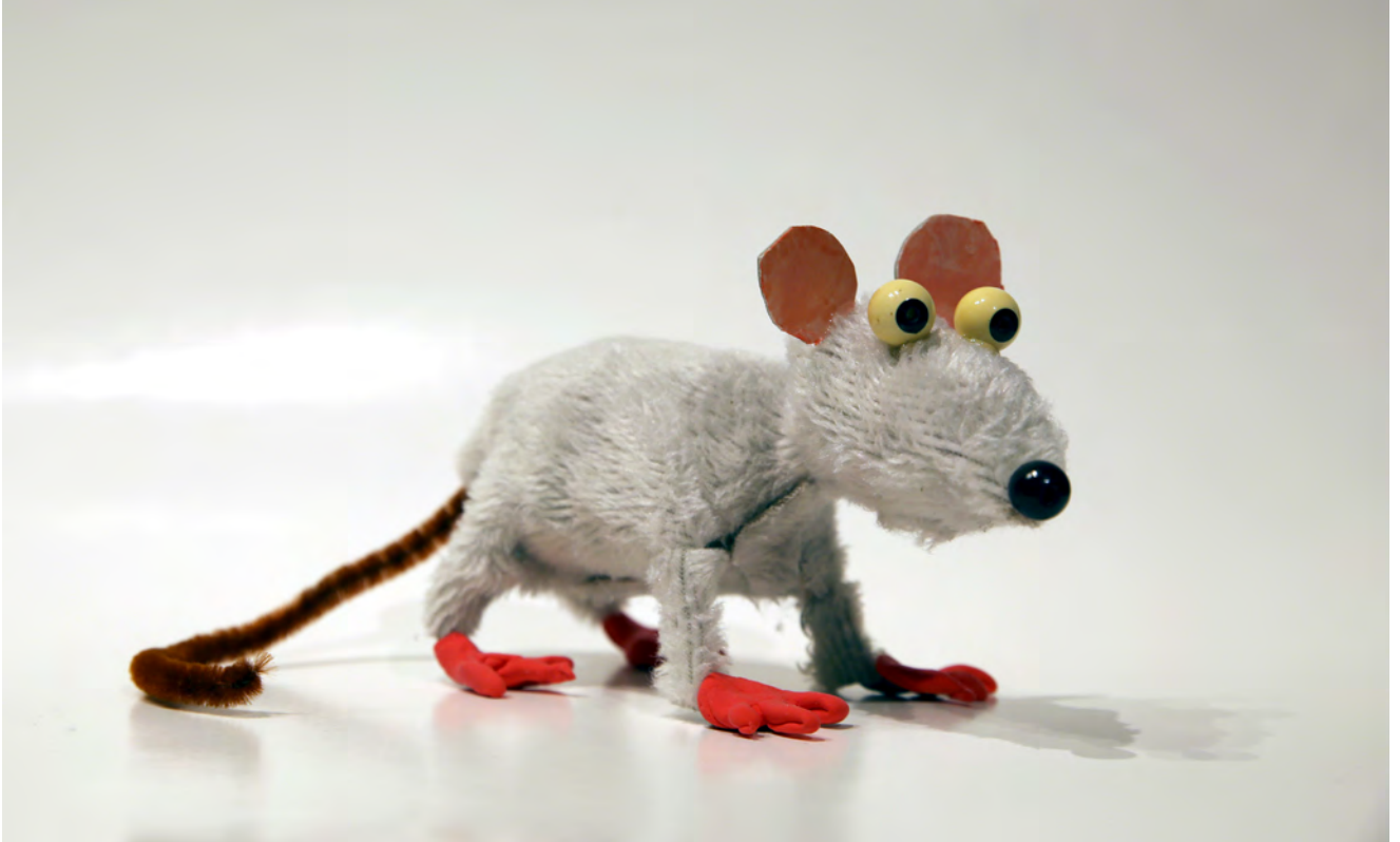
Une nouvelle Whizzy est née !